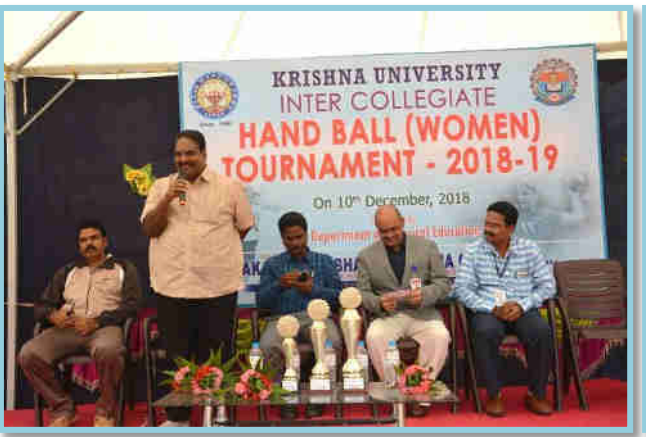
KRISHWA UNIVERSITY INTER COLLEGIATE HAND BALL (WOMEN) TO URN AMENT - 2018-19 On 10" Detenber 2013